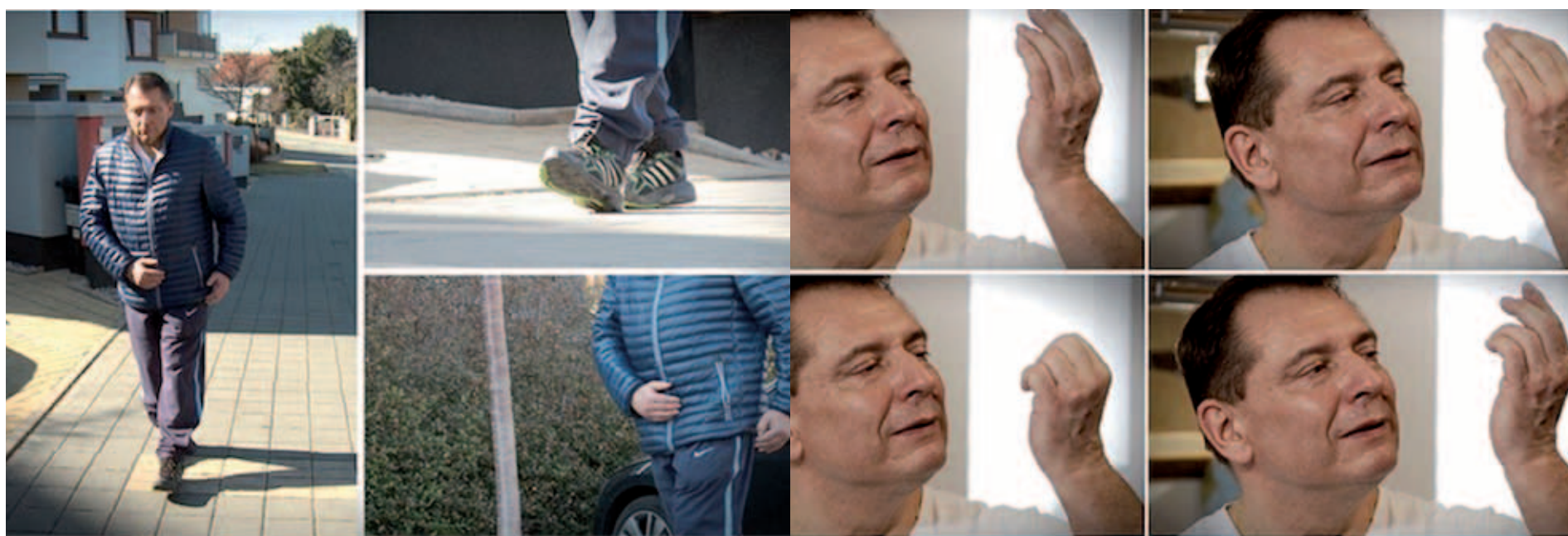
Paroubkem: Chodte jako robot | (1:57) | video: Playtvak.cz